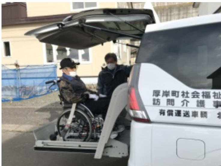
[上]利用者さまを介助している様子