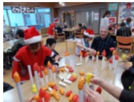
[上]制作・準備段階から利用者さまと取り組んだ「たくさん灯せるかなゲーム」の様子