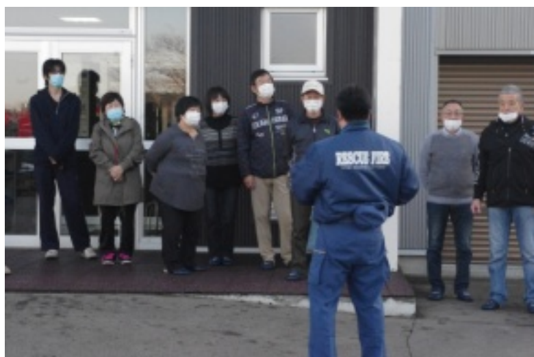
[上]消火器の説明を受ける参加者