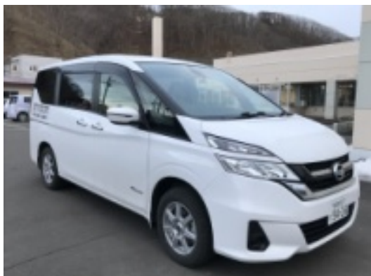
[上]新しく納車されたリフト車

厚岸町社会福祉協議会の指定訪問介護事業所(訪問ヘルパー事業)では、8月から新しいリフト車があり、リフト車が2台となりました。このことにより、外出支援サービスや福祉有償運送などのサービスで、車いすを使用している利用者さまの対応が数多くできるようになりました。