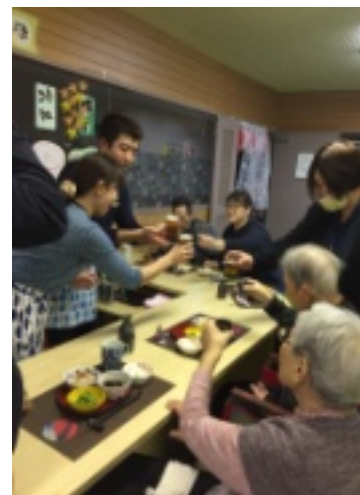
[上]参加者での乾杯