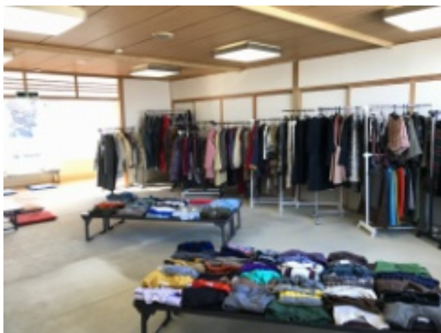
沢山の洋服たちがお出迎え(上)

■ワークサロンでは「古着」などを100円から販売しています。買取はできませんが、皆さんの家で眠っている洋服などを引き取ります。引き取りは、センターまたは工房るうぷで行っていますので、ご協力願います。