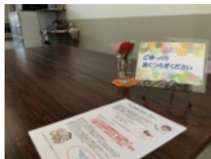
ゆっくりくつろげます(上)

■ワークサロンでは「古着」などを100円から販売しています。買取はできませんが、皆さんの家で眠っている洋服などを引き取ります。引き取りは、センターまたは工房るうぷで行っていますので、ご協力願います。