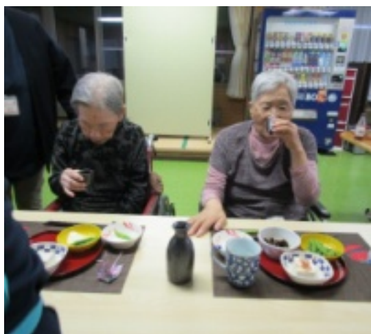
[上]日本酒を嗜まれる利用者