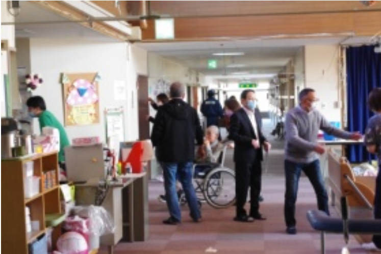
[左]自治会の方々による避難誘導の様子