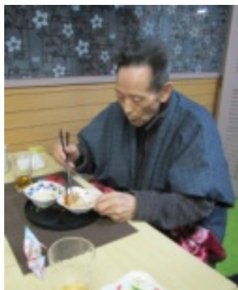
[下]おつまみのお味は？