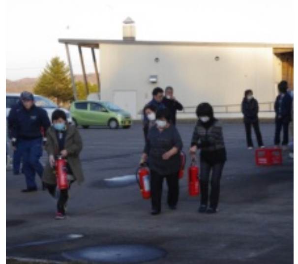
[上]消火器訓練の様子